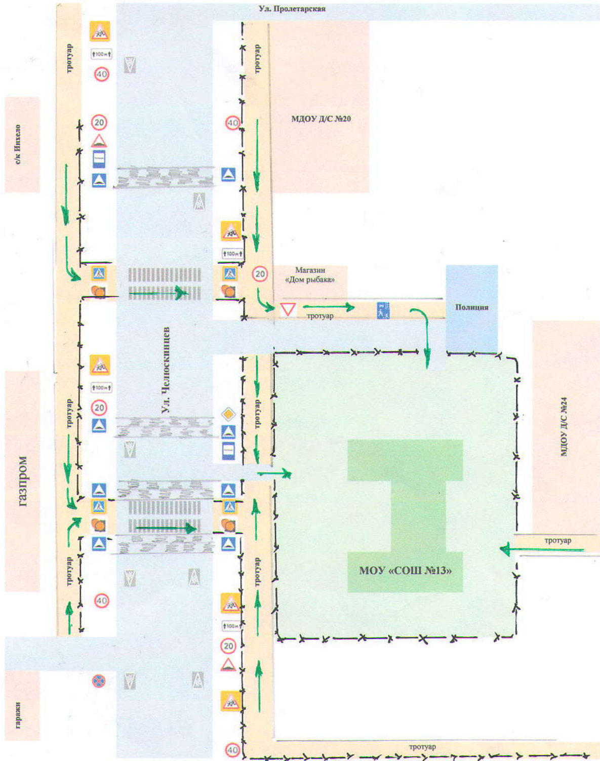
Схема безопасного подхода к МОУ «СОШ №13» со стороны ул. Челюскинцев